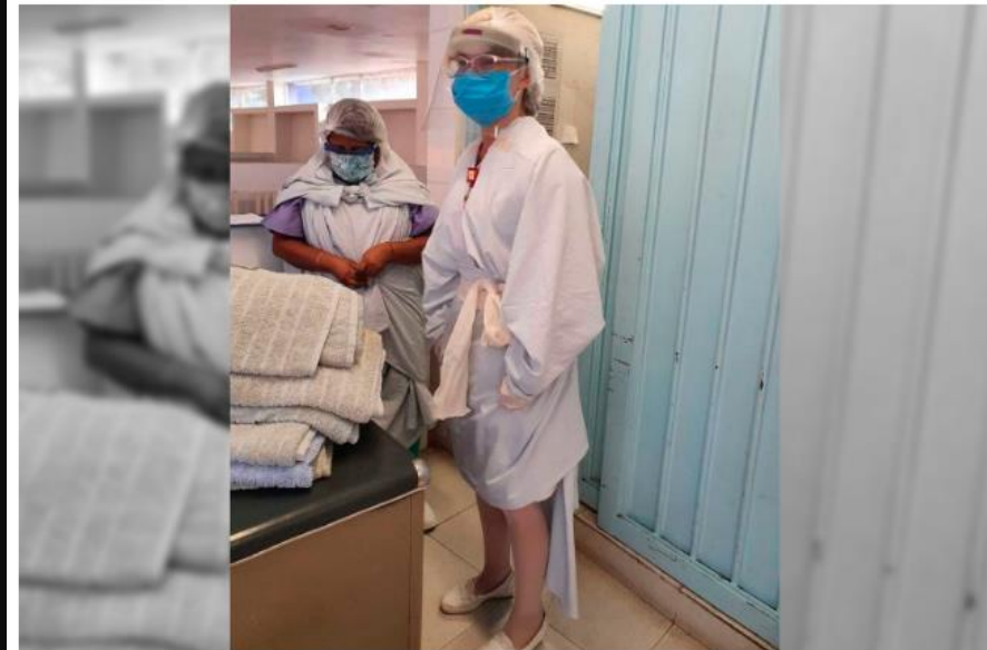
Enfermeras del Hospital Dr. Samuel Ramírez con batas improvisadas.