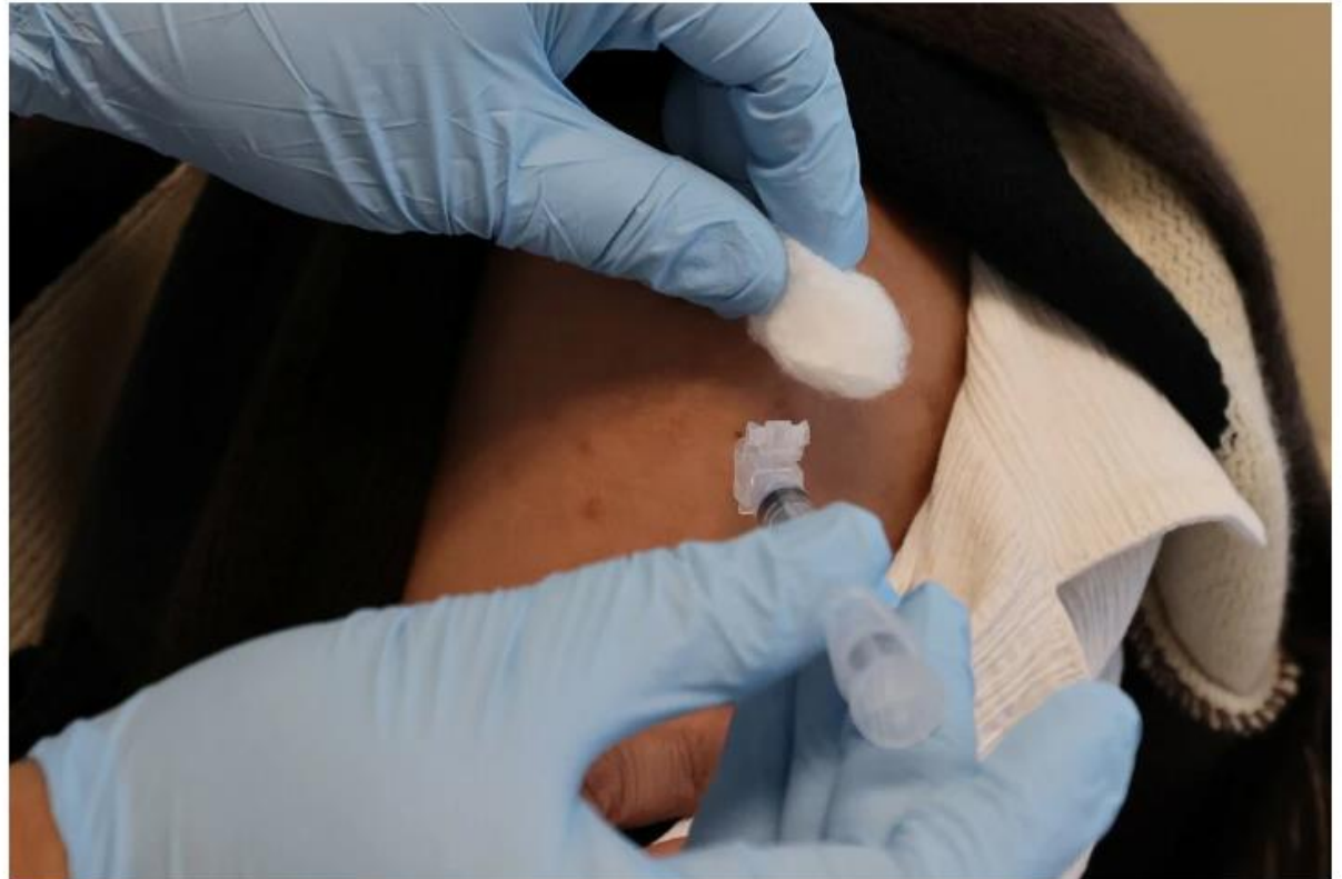
A new analysis of death rates among those with intellectual disabilities and developmental disorders may influence the allocation of coronavirus vaccines.

People with intellectual disabilities and developmental disorders are three times more likely to die of Covid-19, compared with patients without the conditions, a new analysis found.